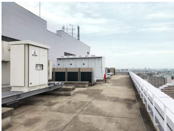
・ 吸排気口がある屋上建屋